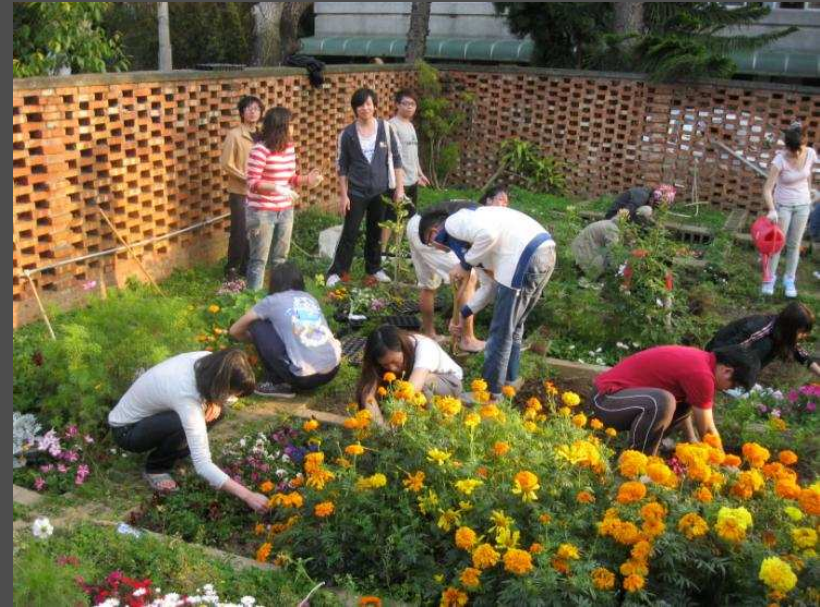
植栽設計課程(植栽場)