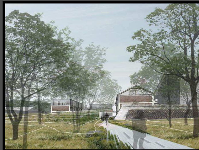
數位景觀模擬作品