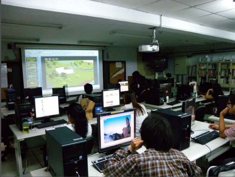
數位景觀模擬課程