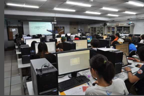
景觀專業電腦教室